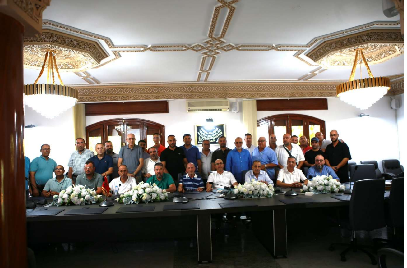
أعضاء غرفة الصيد البحري المتوسطية 2021-2027