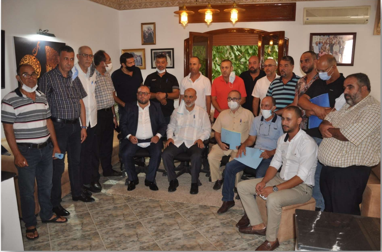
أعضاء غرفة الصيد البحري المتوسطة 2021-2027